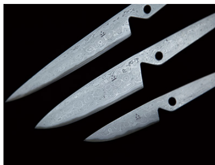
従来商品（伝統的な包丁）