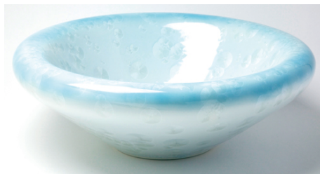
従来商品（伝統的な京焼）