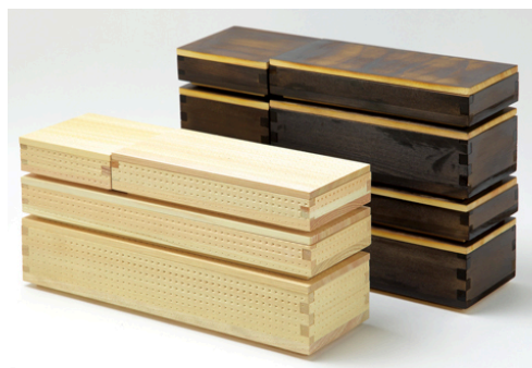
従来商品（伝統的な枡）